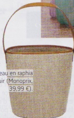
Sac seau en raphia et cuir (Monoprix, 39,99 €).