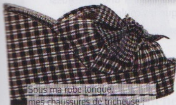
Sous ma robe longue, mes chaussures de tricheuse la hauteur du talon, le confort des compensées. Sandales en cuir et toile (Castañer, 235 €).