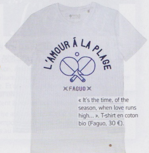
« It's the time, of the season, when love runs high... ». T-shirt en coton bio (Faguo, 30 €).