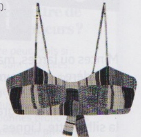
Maillot de bain en coton (Mare Di Latte, 65 € le haut et 55 € le bas).