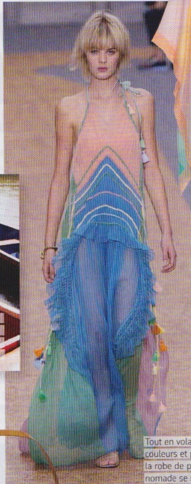
Tout en volants, couleurs et pompons, la robe de princesse nomade se suffit à elle-même. Défilé Chloé printemps-été 2016.