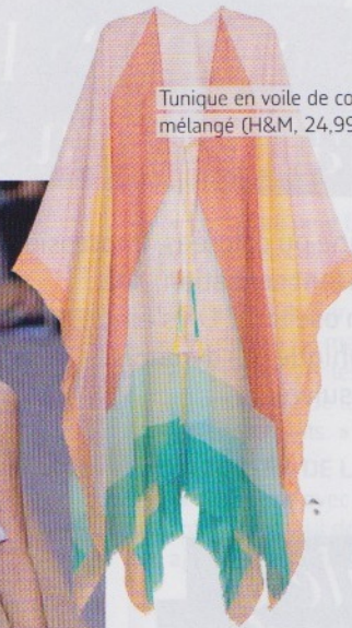
Tunique en voile de coton mêlé (H&M, 24,99 €).