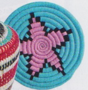
Mon coup de cœur du mois : de la déco hautement désirable « chinée au Maroc avec amour ». Corbeille et dessous de plat en paille et laine (Yüyü Paris, 36 € et 12 €).