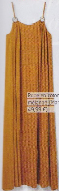
Robe en coton mêlé (Mango, 49,99 €).

Je m'allège! Je ne garde qu'un bijou ultra épuré, comme un gri-gri pour l'été. Collier en or rose 18 carats (Ginette NY, 275 €).