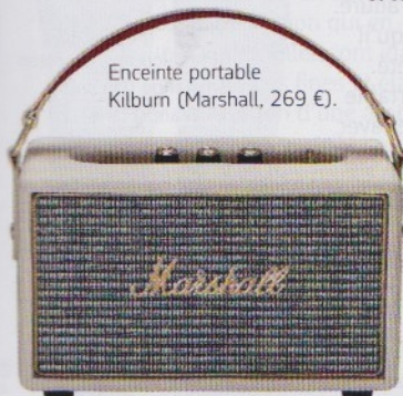
Enceinte portable Kilburn (Marshall, 269 €).