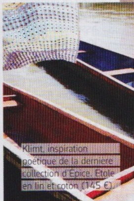
Klimt, inspiration poétique de la dernière collection d'Épice. Etole en lin et coton (145 €).