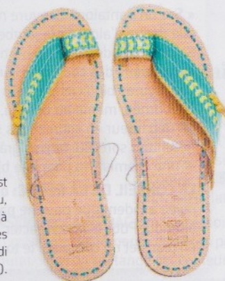
Si ma tête est encore au bureau, mes pieds sont déjà en voyage. Sandales en cuir (Lina Audi pour Liwan, 140 €).